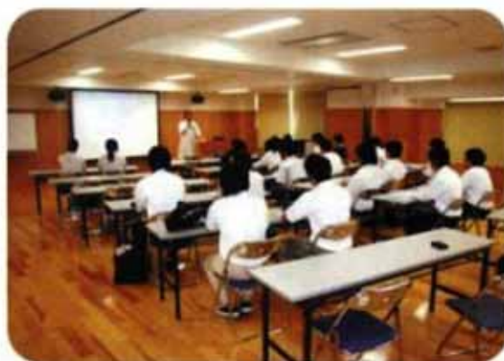
将来の医療スタッフに心構えを熱弁!