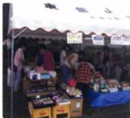
掘り出し物を捜して...

会が「ふれあいバザー」で参加しています。今回もさまざまな品物が出店されていきました。品物は会員さんに加え、菊南病院の院長先生をはじめ職員の方々も持ち寄って下さっています。売れ行きは、はじめは、あいにくの天気で家族会の方も会員さんも心配そうな様子でしたが、時間が経過するにつれお客さんも増え、最終的には、ほぼ昨年同様の売り上げだったとのことでした。バザー出店にはお手伝いとして、リハビリの学生も参加しました。日頃の練習内容と違った体験に戸惑いもあったようですが、時間がたち接客に慣れてくると、家族会の奥様達のようにお手伝いになっていたようでした。今年はそのに加えて当院の室