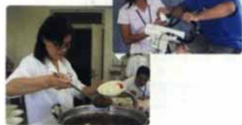
栄養部の愛情いっぱいカレー