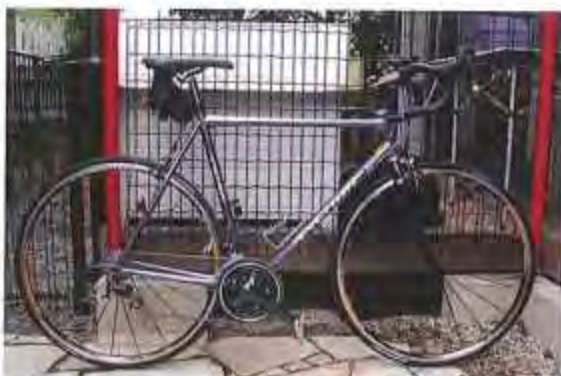
入門用のロードバイク

ロードバイクの人気ブランドは元来ロードバイクが発展してきた欧米（特にイタリア・フランスなど）のメーカーですが、アジアでは台湾が有名で、今では欧米のブランドの一部も製造は台湾、というのでも少なくありません。わたしの場合、どのメーカーにするか迷いましたが、あえて国産を大事にして、ブリジストンの入門用のロードバイクを買いました。そして休日に、東バイパスをひたすら西の方向に進んで熊本新港まで、などサイクリングをするように