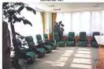
人間ドック待合室