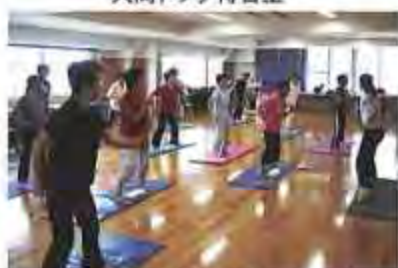
ハツラツ運動教室