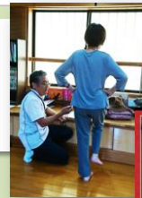
いきいき百歳体操 くまもどバージョン♪