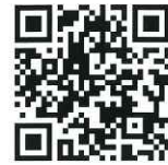
一般用(内科・整形など)