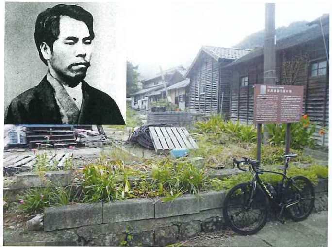
金森通倫と天水町小天の生誕地

このように「肥後もっこす」な一面も見せた金森通倫ですが、まさか自分の曾孫(長男の娘の子)が総理大臣になるうとは、夢にも思わなかったでしょうね。