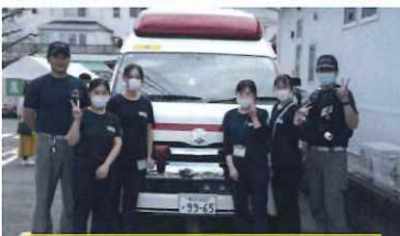
救急車展示& なりきりナース・ドクター