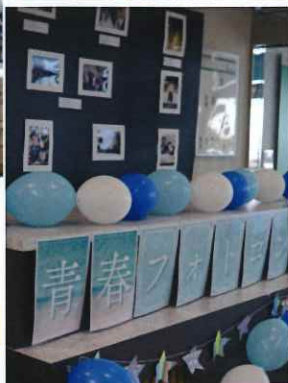
青春フォトコンテスト